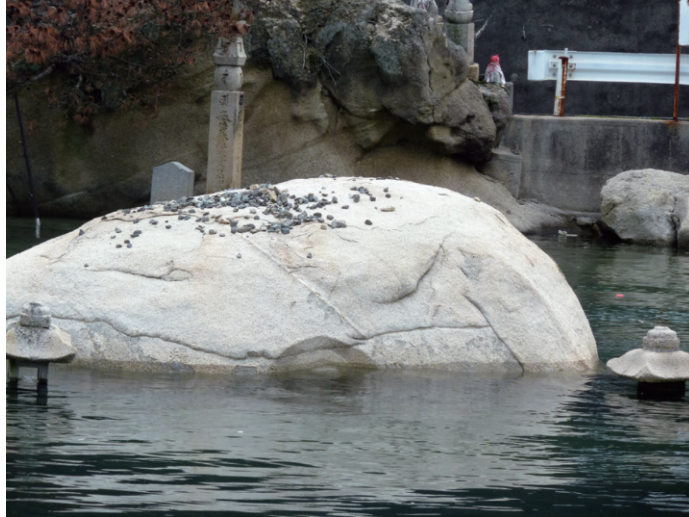
図2 満潮時の磨崖和霊石地藏 (2012年撮影)

仏の一部または全部が海面下に沈む状況にある(図2)。満潮時海水面は日によって変動するが、気象庁で公表されている最も近傍の水位観測点である糸崎の2016年の潮位表 5) に基づいて見積もると、おおむね像の顎または首辺りが平均満潮時水位と推測され、その辺りから下の岩塊表面は藻類と思われる暗色物質に覆われた状態にある(図1)。像では一般に下部において、顔などの像上部に比べると体や衣などの形状表現に現在はシャープさが認められず(図3)、築造時に比べて侵蝕が進行している可能性が考えられるが、目鼻などの像上部は比較的シャープさを留めている。以上のように、潮位の関係から磨崖仏表面は多かれ少なかれ毎日必ず波に打たれることになり、また乾湿の繰り返しなどから地元では「磨崖仏は近年になって急速に劣化が進行しているのではないかと 6) 」と懸念されていた。しかしながら、現在は干潮時の限られた時間しか像に近づくことができなため客観的な科学データは存在せず、それはあくまでも主観的な印象に過ぎない。