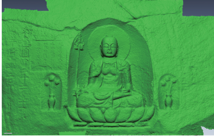
図7 レプリカの三次元モデルのオルソ画像

レオ技術に関するこれまでの精度検証結果 10) に基づき、今回の方法による計測誤差は0.7mm以内と計算されるが、肉眼で差異を認知できるレベルの違いを前提として、本研究では相互に3mm以上の変位が認められた地点をこの30年間に変位が認められた箇所と認定して抽出した。この変位箇所を統合されたレプリカの三次元形状モデル上に色分けして表示した上で、磨崖仏に正対する位置から見たオルソ画像として出力したものが図8となる。