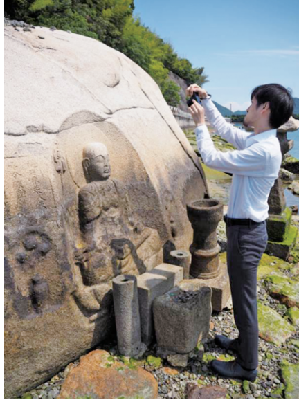
図5 磨崖和霊石地藏における調査風景 コンパクトデジタルカメラによる写真撮影

ative Closest Point (ICP) 9) と呼ばれる手法を利用し、各モデル間の偏差の総和(最近傍偏差)が最小になるように計算して行った。現在の磨崖和霊石地藏の三次元形状モデルに正対した点群オルソ画像を図6に、レプリカの三次元形状モデルに正対した画像を図7に、それぞれ示す。