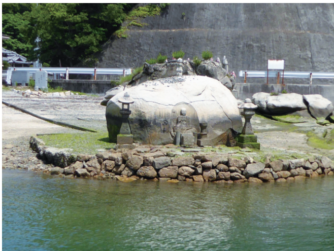
図1 干潮時の磨崖和靈石地蔵（2016年撮影）

磨崖和靈石地蔵（図1）は三原市佐木島の花崗岩塊に刻まれた広島県指定重要文化財の磨崖仏 3) で、銘文から西暦1300年に佛師念心によって製作されたことが確認される。磨崖仏の彫られている大きさ2m程の花崗岩塊は、この地域に広く分布する白亜紀の花崗岩類である広島花崗岩類が、自然の風化・侵蝕を受けて残った球形に近い形状のコアストーン 4) と判断され、その海側（西面）の側面に1m程の大きさの地蔵坐像が薄肉彫りで表現されている。花崗岩塊は海岸の波打ち際に存在し、現在は干潮時には像全体が海面上に姿を現す（図1）が、満潮時には石