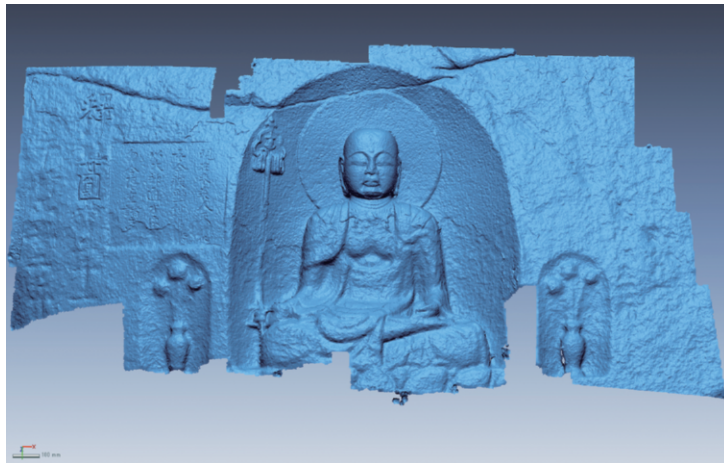
図6 磨崖和霊石地藏の三次元モデルのオルソ画像

当初状態により近い形状を保っていたと考えられる、レプリカの三次元形状モデルに基づき、現在の磨崖和霊石地藏の三次元形状モデルの位置合わせを行った後、両者の間のずれの最短距離を算出し、モデル間の差分を求めた。その際には、大域的な歪みによる影響を除くため、31枚の部分的な三次元形状モデルごとに比較を行い、局所的な差異のみを抽出した。多視点ステ