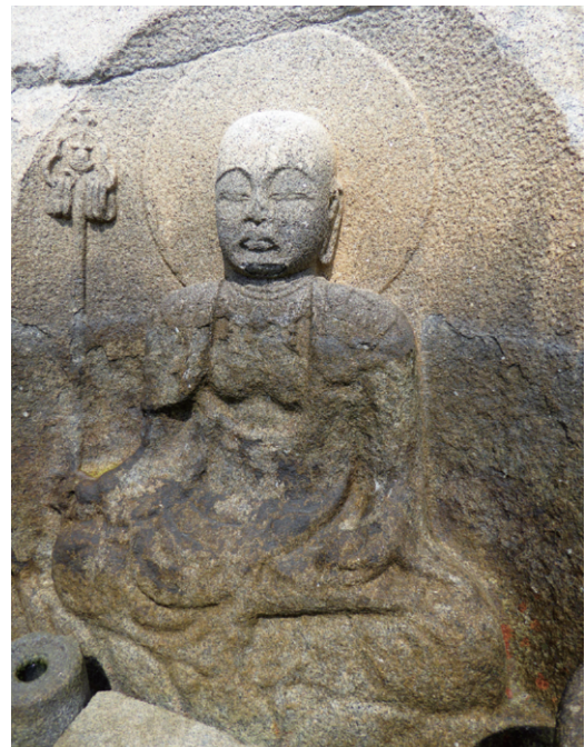
図3 磨崖和霊石地藏の現在の表面状態(2016年撮影)

この像の現在の劣化状態を客観的に議論するための有力な判断材料として、1986年に造られたレプリカ(図4)の存在が知られている。これは、岩塊の大部分を型取りすることによって