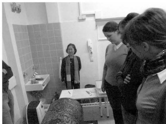
図6 修復方法について Fig. 6 About restoration methods