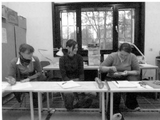
図4 麦漆について Fig. 4 About mugi-urushi