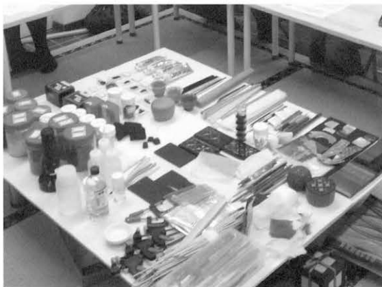
図1 漆芸道具・材料 Fig. 1 Tools and materials for urushi