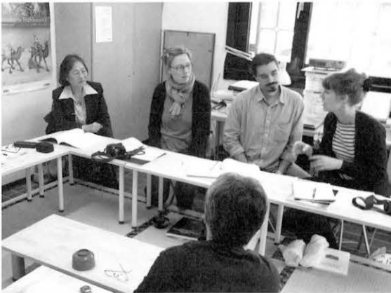
図9 修復理念について