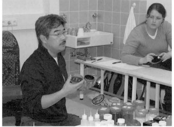
図8 制作工程について