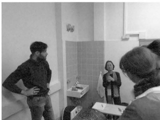
図5 修復理念について Fig. 5 About the principle of restoration