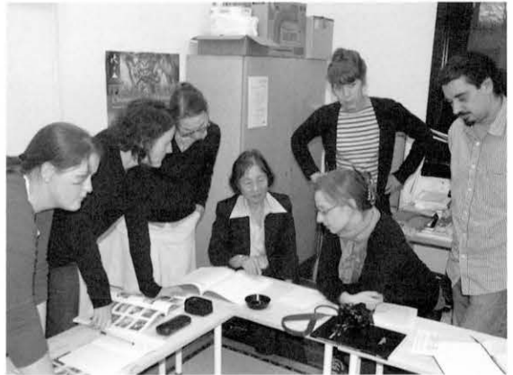
図10 修復方法について