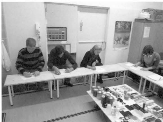
図2 ワークショップI (1日コース) Fig. 2 Workshop I (1-day course)