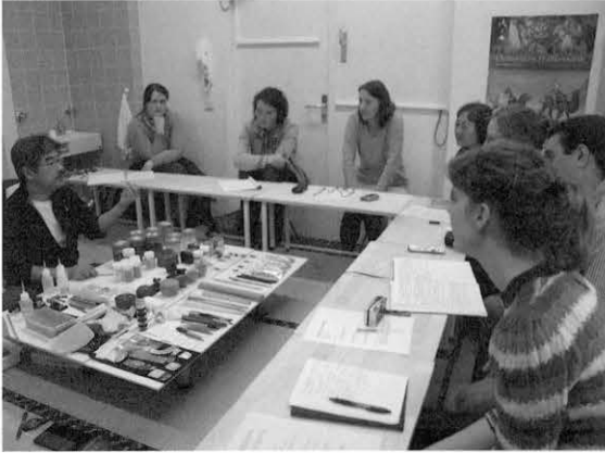
図7 道具・材料の説明