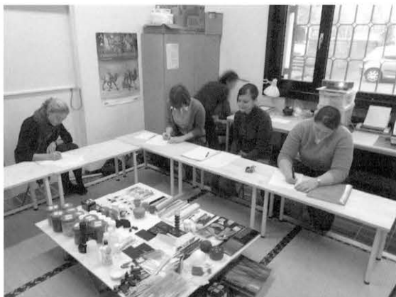
図3 ワークショップI 受講者 Fig. 3 Workshop I, participants