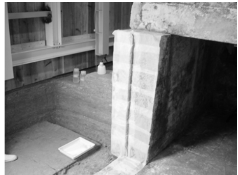
写真8 エタノールによる汚染面の消毒 （2007年5月17日）