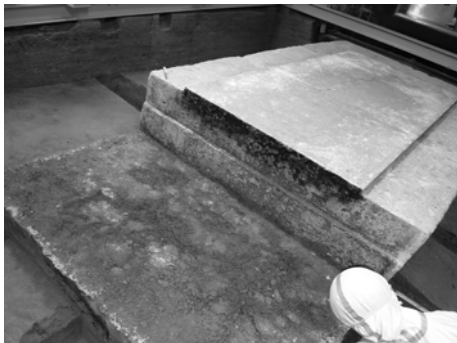
写真7 床4石解体後（2007年8月20日）