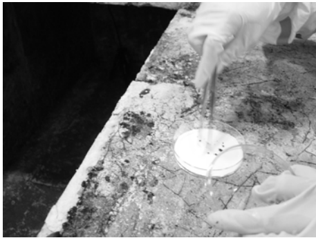
写真5 西3石（西女子群像）上面小口 （2007年4月25日）