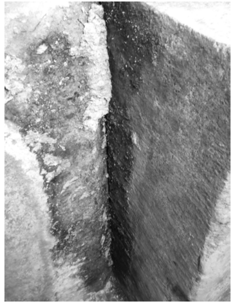
写真6 南壁と東1石の接合部の漆喰を外した後 （2007年6月11日）