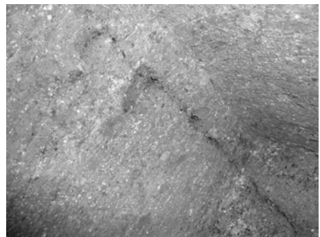
写真10 地震痕跡の亀裂の例（2007年8月20日）