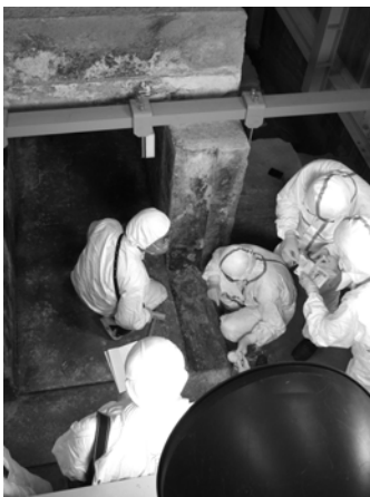
写真3 西2石北小口（2007年5月10日）