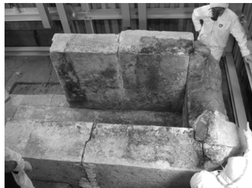
写真4 天井石1を外した後（2007年5月30日）