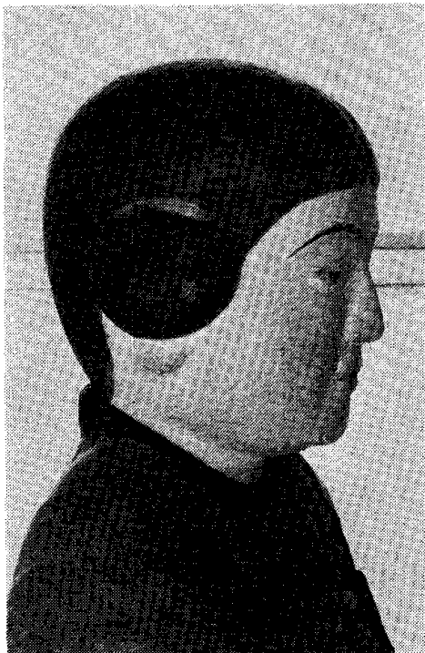
図-5 面部修復後 Fig. 5 After treatment