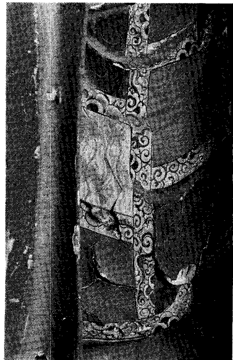
図-3 袈裟部の彩色の剥れ Fig. 3 Before treatment