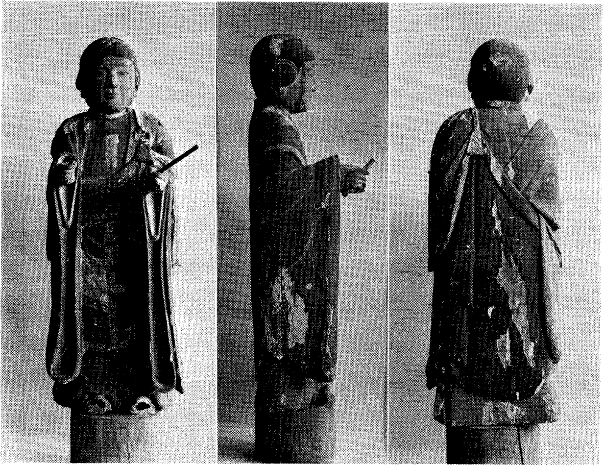
図-1 修復前 Fig. 1 Before treatment