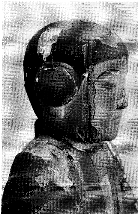
図-2 面部の彩色の剝落 Fig. 2 Before treatment