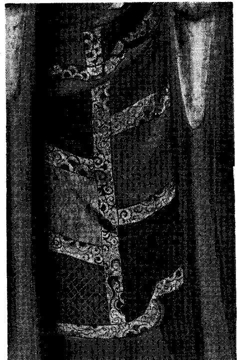
図-6 袷装部修復後 Fig. 6 After treatment