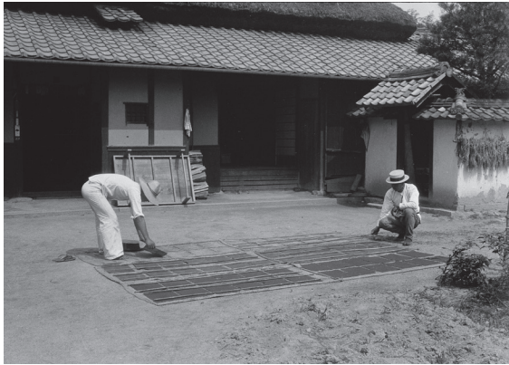
写真7 青花紙の乾燥