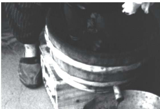
5 カット22 タルの中でアオバナの花弁を漉し 布で絞り、汁を絞り出す作業