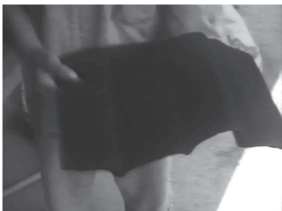
9 カット19 青花紙を手にする人物