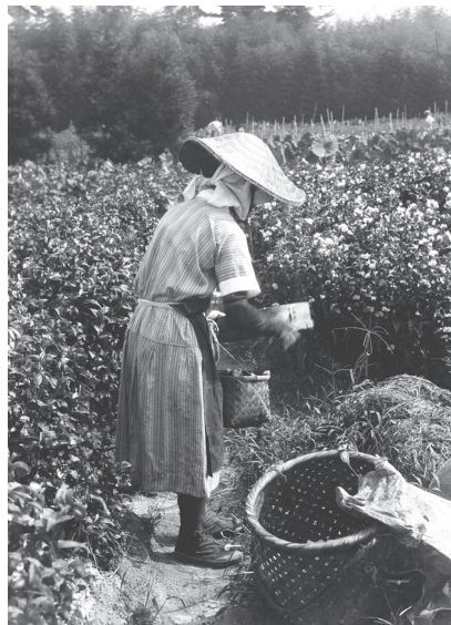
写真4 オホボウシバナの花冠と雄蕊の分離