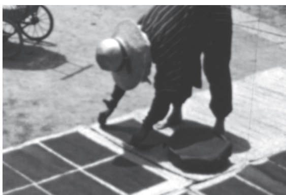
9 カット29 アオバナの汁が塗られた和紙をゴザの上に並べ、天日で乾燥させる作業