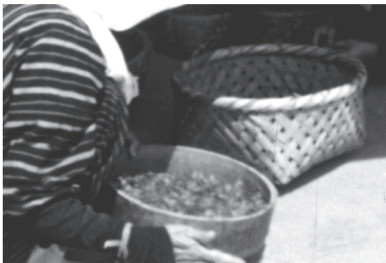
3 カット12 アオバナの花弁をふるいにかけて、 ゴミを取り除く作業