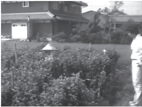
1 カット1 アオバナの畑の様子