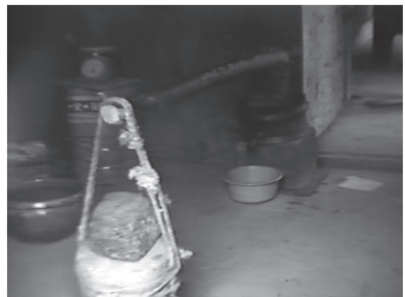
6 カット13 梃子の力点側に重しを吊り下げた様子