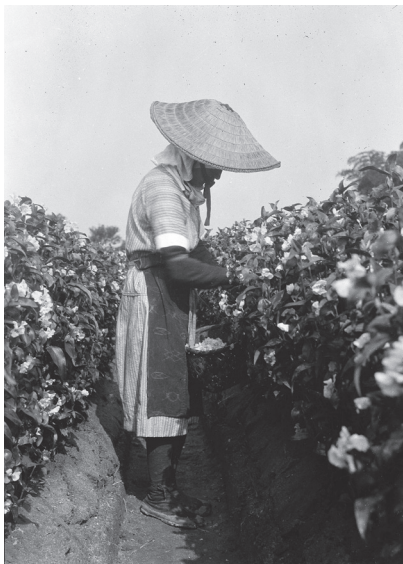
写真3 オホボウシバナの花の採取状況