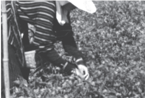
1 カット4 アオバナを摘む作業