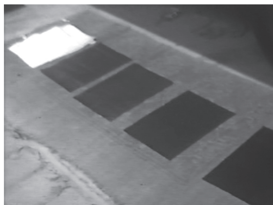
10 カット21 青花紙の未成品を塗りの工程ごとに並べた様子