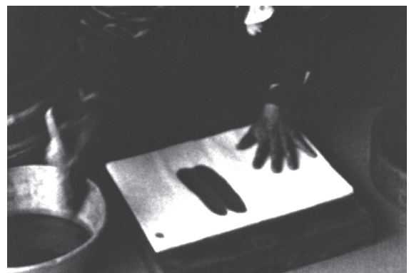
6 カット23 アオバナの汁をハケで和紙に塗る 作業