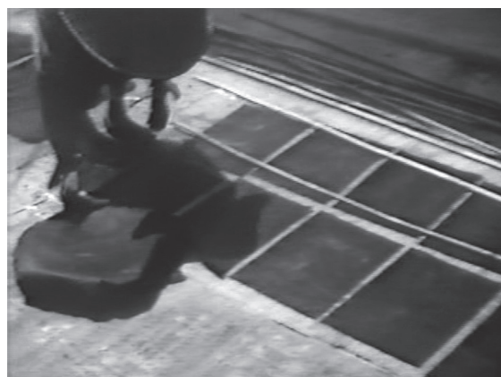
8 カット17 アオバナの汁が塗られた和紙をゴザの上に並べ、天日で乾燥させる作業