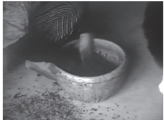
4 カット9 ふるいにかけたアオバナの花卉を金属製の容器に移し、その中でアオバナの花卉をこねる作業