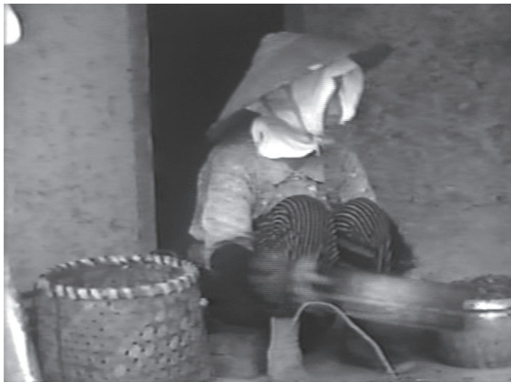
3 カット6 カゴからアオバナの花卉を取り出してふるいにかける作業