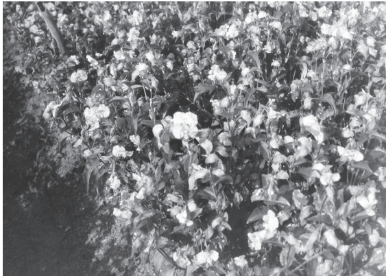
写真1 栽培せるオホボウシバナの開花