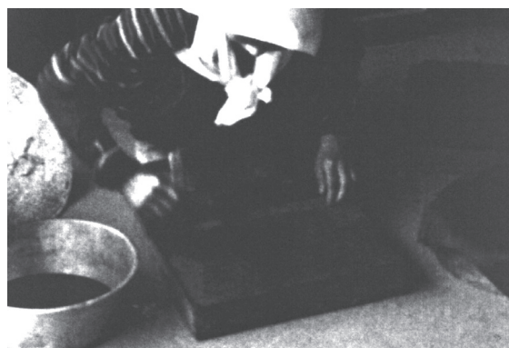
8 カット28 アオバナの汁をハケで和紙に塗る作業