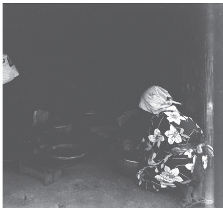
写真5 青花汁搾取状況