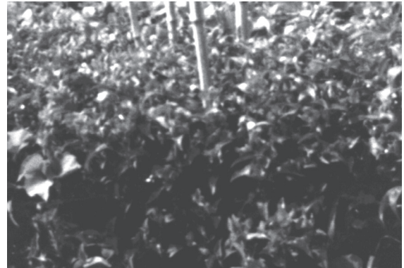
2 カット9 アオバナの畑の様子