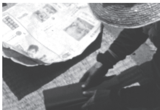
10 カット34 たたまれた青花紙を新聞紙に包む様子