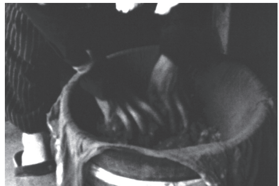
4 カット19 タルの中でアオバナの花弁をこねる 作業