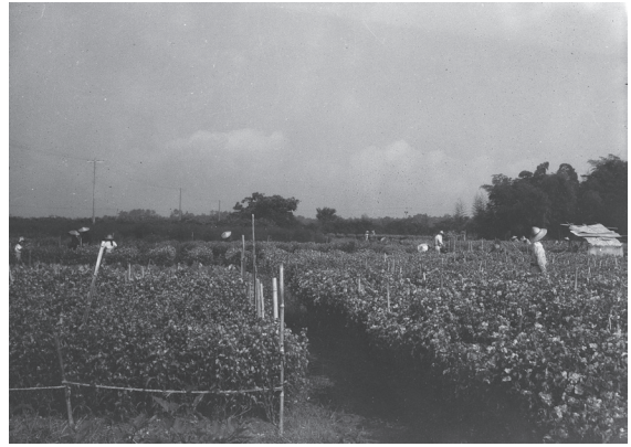
写真2 オホボウシバナの栽培状況