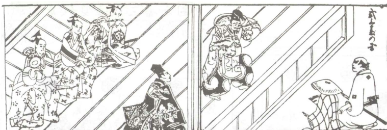
(D) 『役者大鑑』元禄5年刊記より（『歌舞伎評判記集成』第1巻 岩波書店 所収）