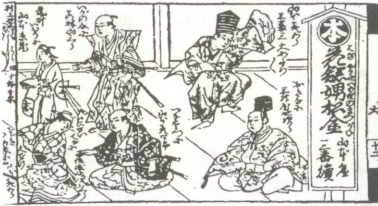
(B) 『役者節饗応』より (『歌舞伎評判記集成』第10巻 岩波書店 所収)