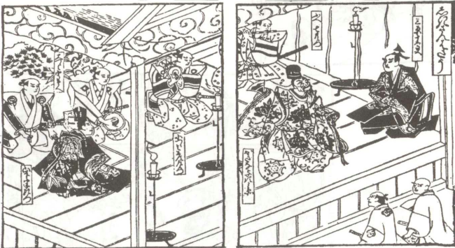
(C) 『難波立聞昔語』より (『歌舞伎評判記集成』第1巻 岩波書店 所収)