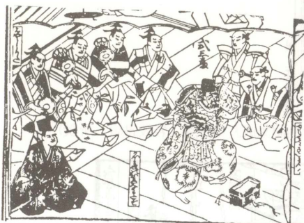
(F) 『嵐百人鬘』より（『歌舞伎評判記集成』別巻 岩波書店 所収）