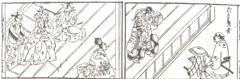
(E) 『役者大鑑』元禄8年刊記より（『歌舞伎評判記集成』第2巻 岩波書店 所収）