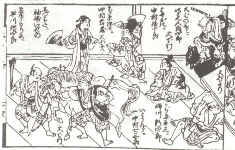
(G) 『役者三津物』より（『歌舞伎評判記集成』第10巻 岩波書店 所収）